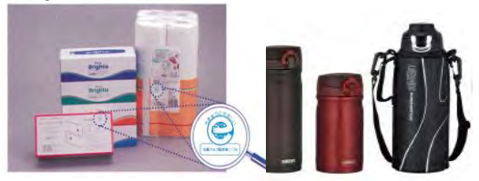
トイレットペーパーやティッシュ、 ステンレスボトルなど