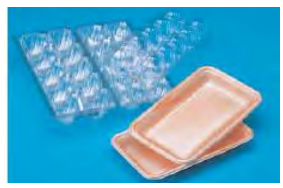
食品トレイや卵パック