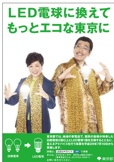
このポスターが協力店の目印です